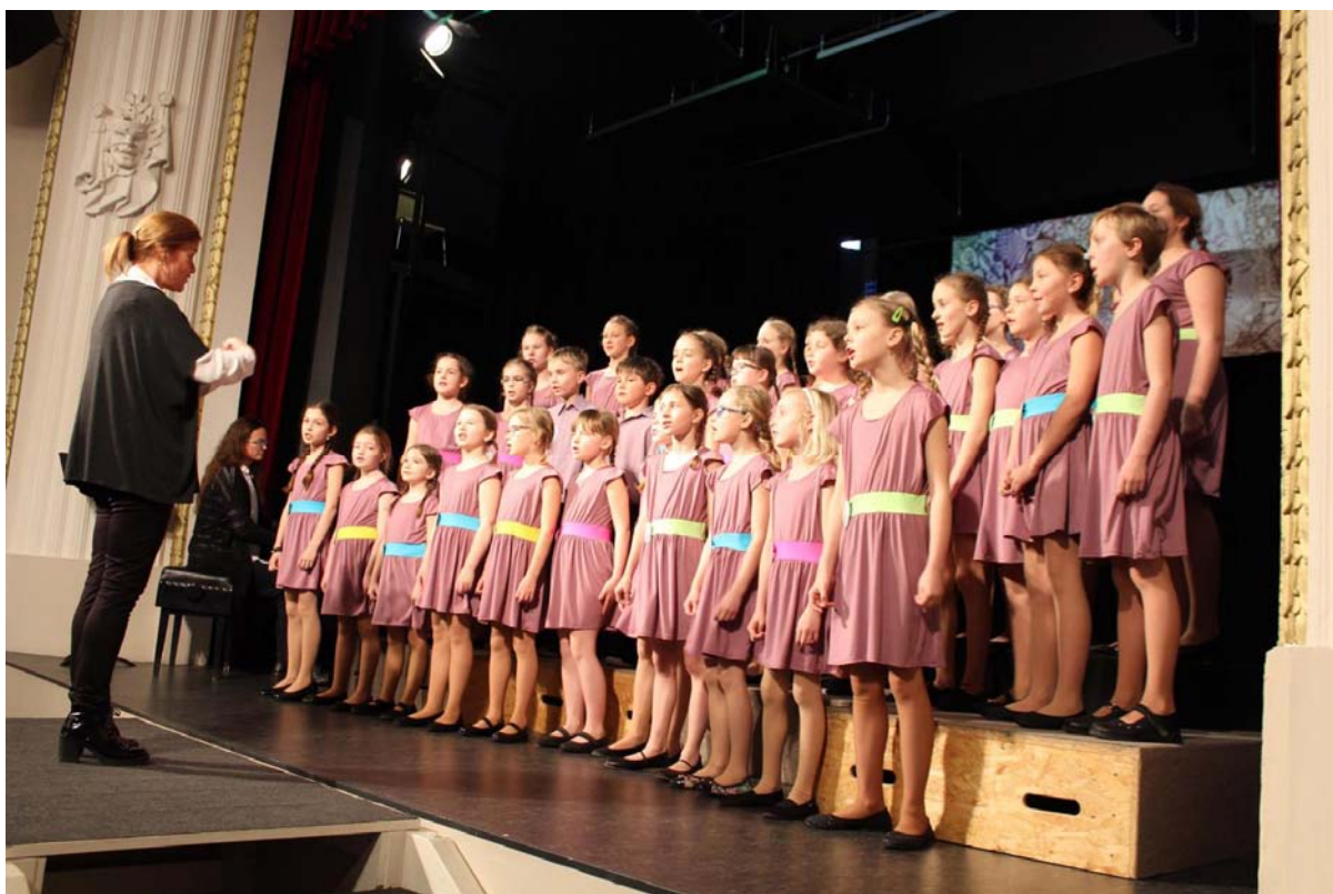
Foto: ZUŠ Václava Talicha pořádala krajské kolo soutěže pěveckých sborů