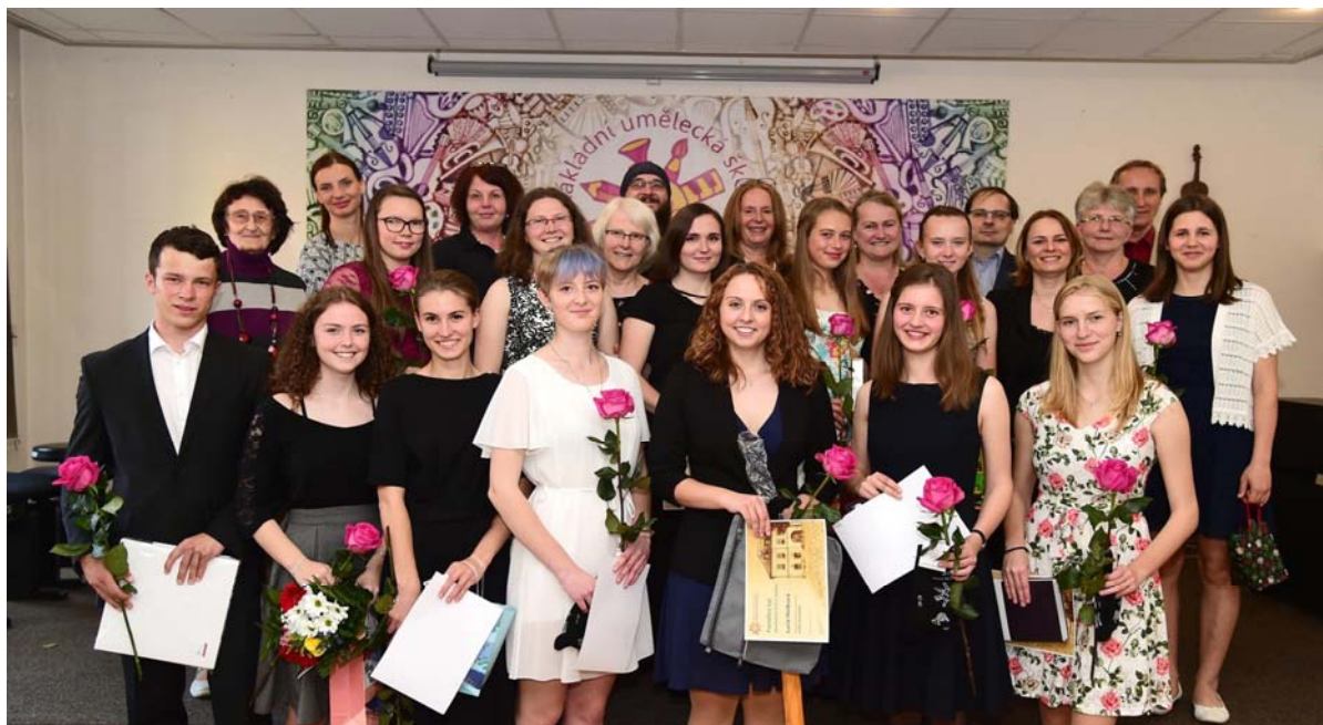
Foto: Absolventský koncert III. 21.5.2019

Pedagogové absolvovali v průběhu školního roku kurzy a semináře dle plánu DVPP. Z převážné části se jednalo o jednodenní semináře pořádané akreditovanými společnostmi NIDV a VISK. Škola pořádala již tradičně školení pro učitele hudební nauky, kterého se zúčastnili rovněž učitelé ZUŠ V.Talicha.