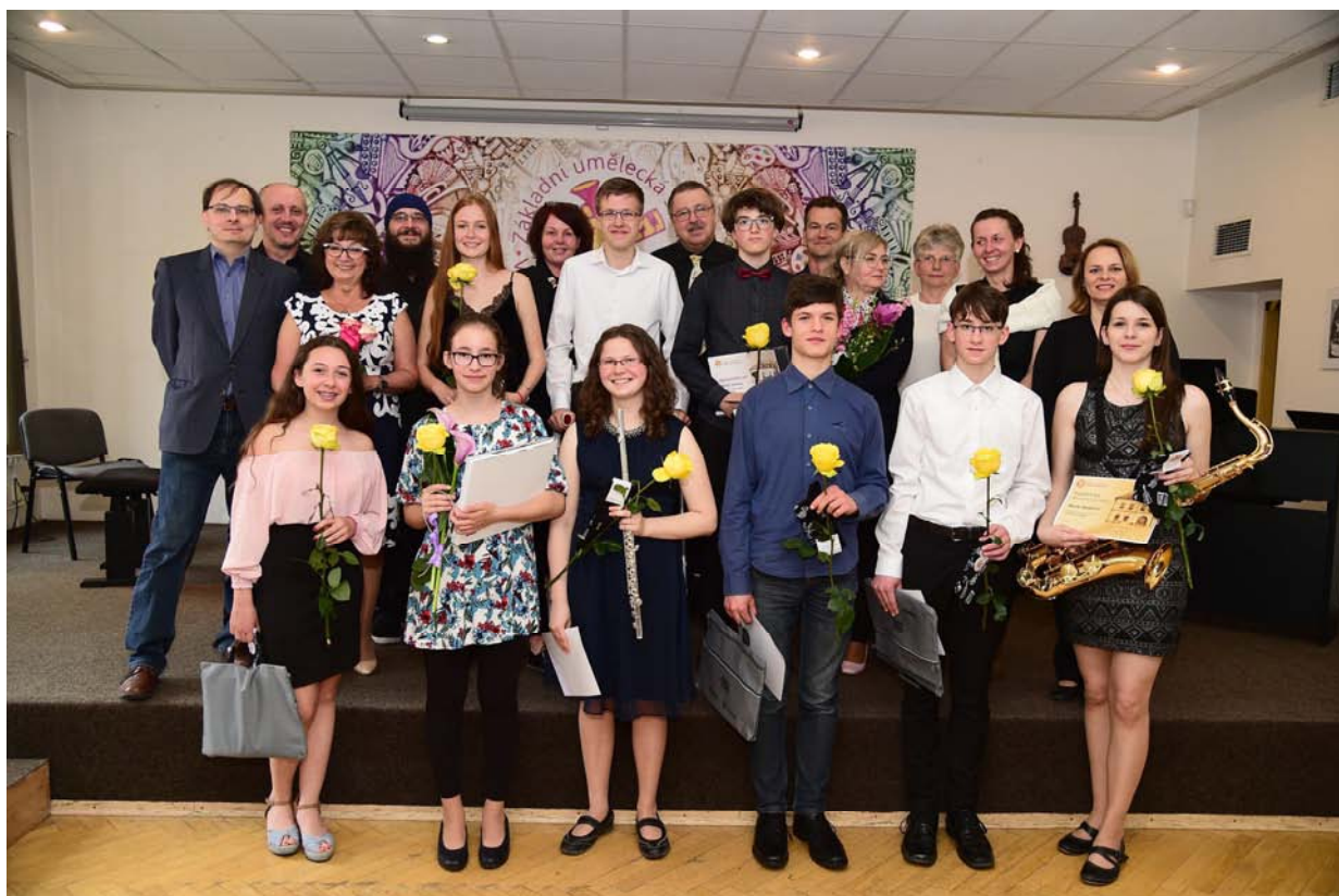
Foto: Absolventský koncert I. - 17.5.2019