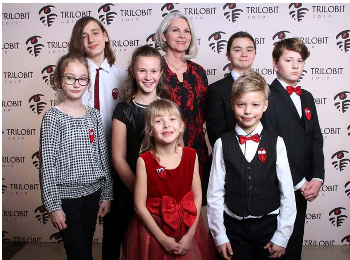
Foto: Dětská porota hodnotící audiovizuální díla pro děti a mládež na festivalu Trilobit Beroun 2019.