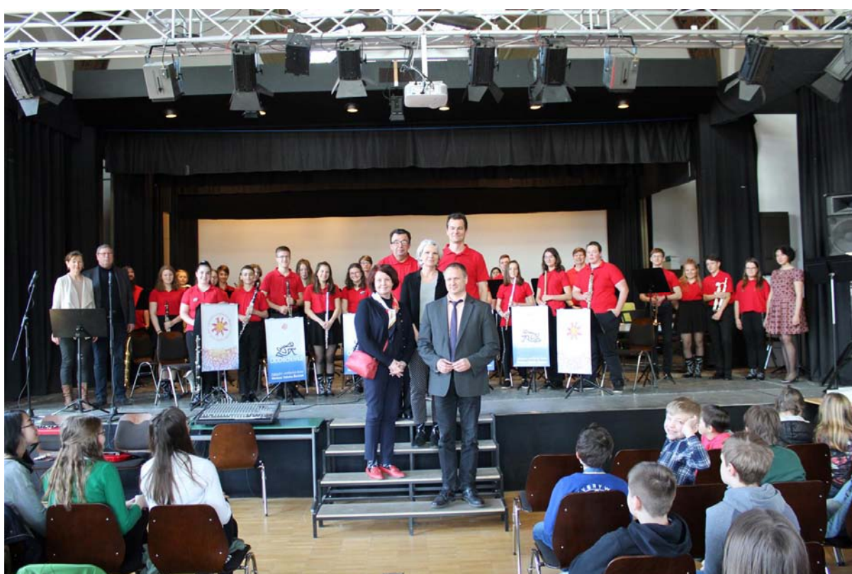
Foto: Společný koncert se Symphonisches Orchester Ratsgymnasium Goslar v aule Ratsgymnasium