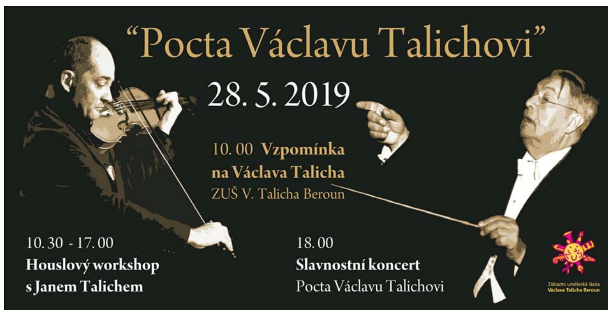
Foto: U příležitosti výročí narození Václava Talicha se konal workshop s Janem Talichem