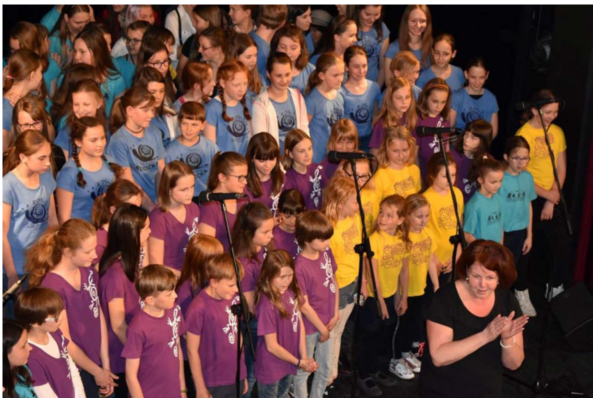
Foto: ZUŠ Václava Talicha spolupořádala přehlídku pěveckých sborů

Významnou událostí pro sbor byla spolupráce v rámci projektu ZUŠ OPEN, kdy si za doprovodu vynikajícího žákovského orchestru zlínského kraje společně s dalšími sbory z celé republiky zazpíval ve Valdštejnské zahradě skladby z francouzského filmu Slavíci v kleci.