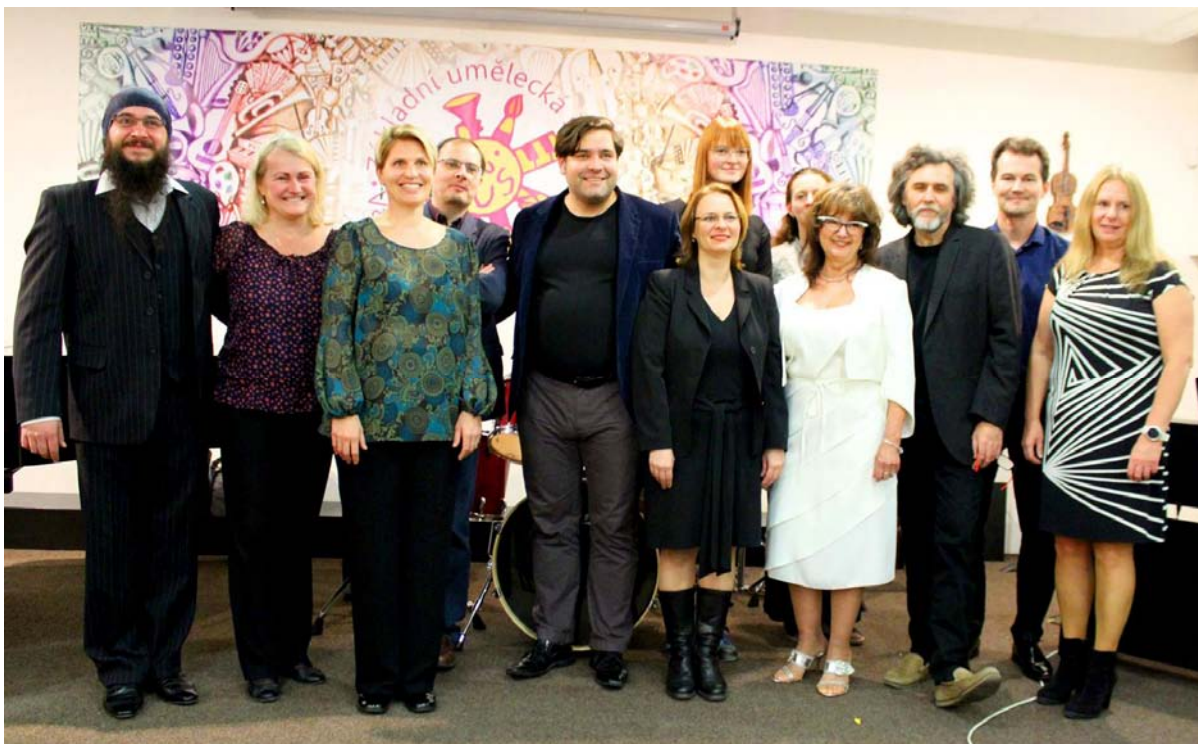
Foto: Koncert učitelů ZUŠ se koná již tradičně v září jako doprovodná akce MHF Talichův Beroun