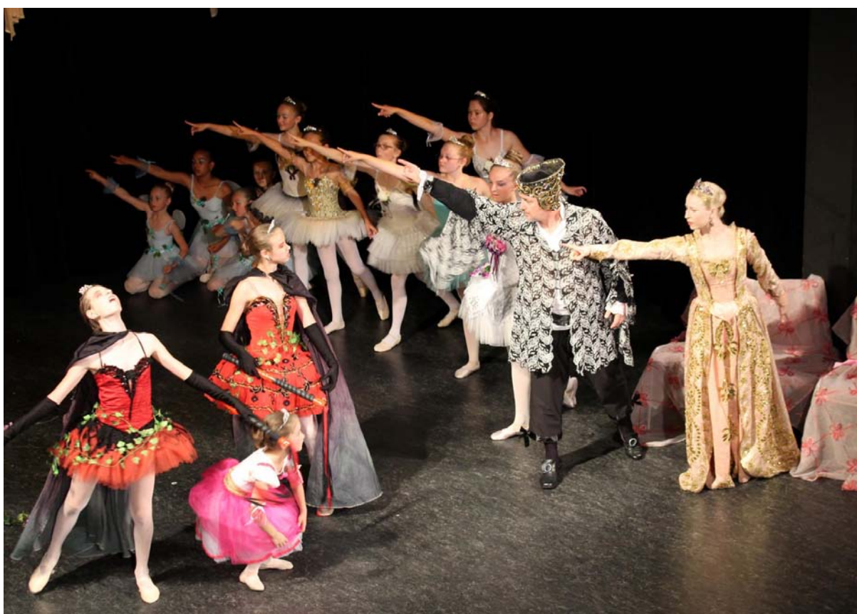
Foto: Závěrečné vystoupení tanečního oboru – výpravné nastudování baletu Růženka

Závěrečné vystoupení tanečního oboru bylo velmi výpravné a spolupracovali na něm všichni vyučující a všichni žáci tanečního oboru. Na přípravě scény a kulis se podíleli žáci výtvarného oboru školy. Představení baletu Růženka se konalo na pódiu KD Plzeňka.