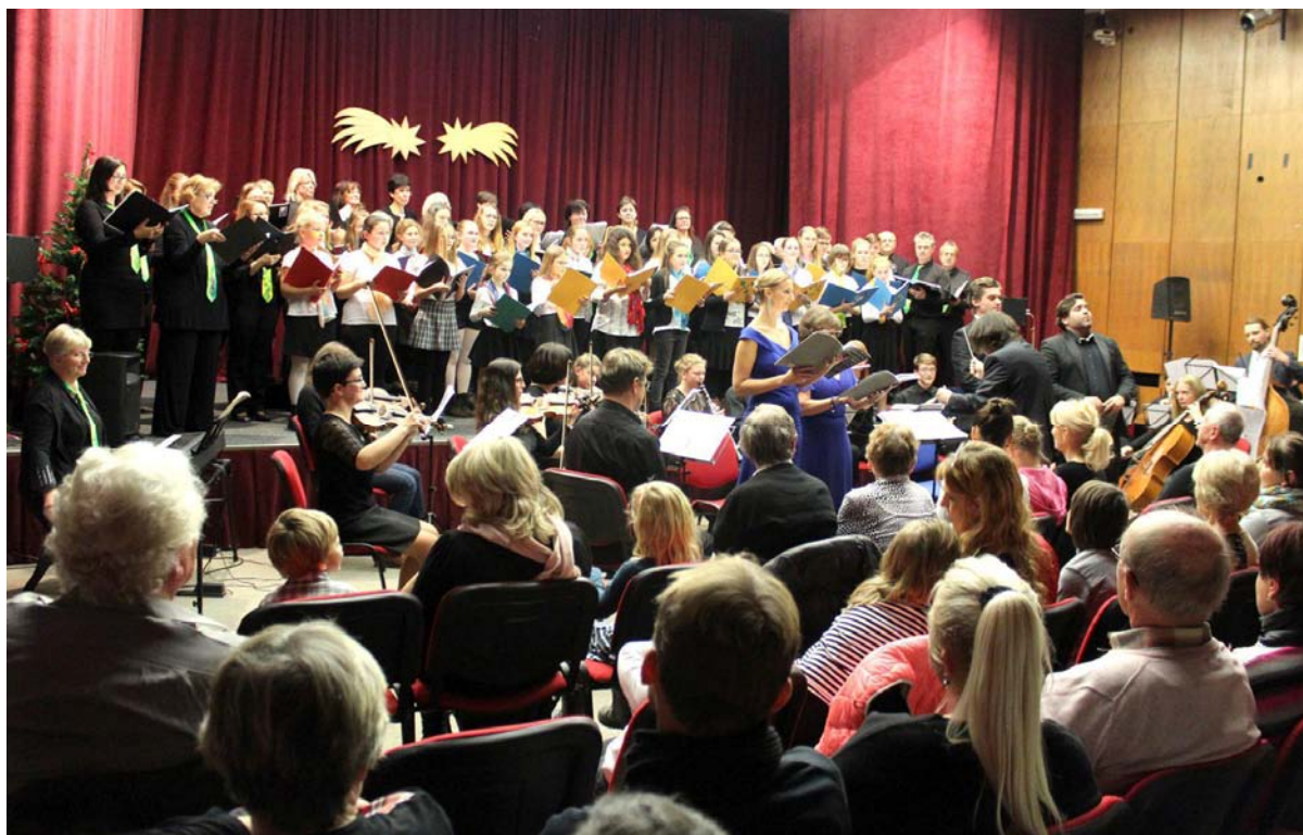
Foto: Vánoční koncert Česká mše vánoční J. J. Ryby v sále České pojišťovny Beroun

V prosinci 2018 realizovala škola společný projekt za spolupráce pěveckých sborů, orchestrů školy, žáků, učitelů a hostů. Jednalo se o nastudování a provedení České mše vánoční J. J. Ryby. Toto představení bylo realizováno při vánočním koncertě v sále České pojišťovny v Berouně v sále hořovické radnice a rovněž ve společenském domě Zdice.