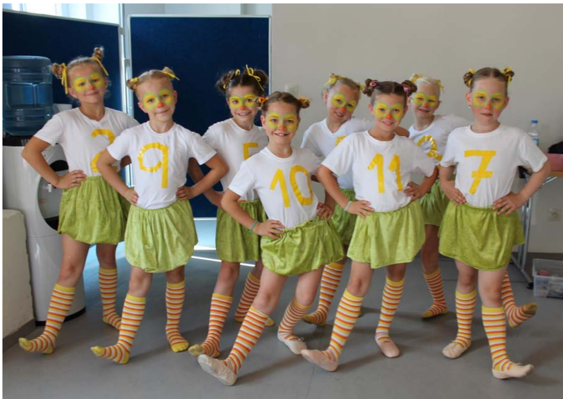
Foto: Závěrečné vystoupení tanečního oboru – choreografie „Na louce“