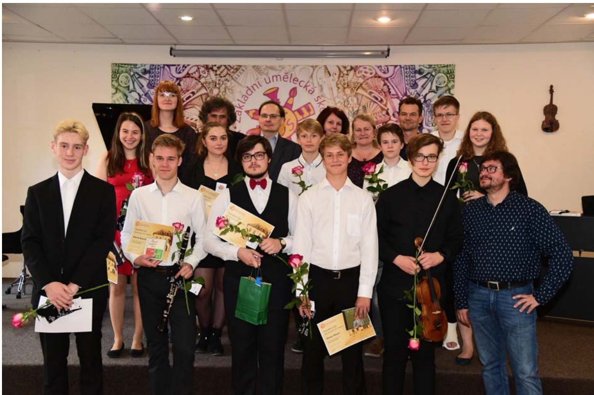
Foto: Absolventský koncert II. 20.5.2019

Hudební obor – žák hudebního oboru byl přijat na Konzervatoř Praha na obor elektrická kytara, jedna žákyně pěveckého oddělení byla přijata na Mezinárodní konzervatoř a jedna na Hudební gymnázium v Praze.