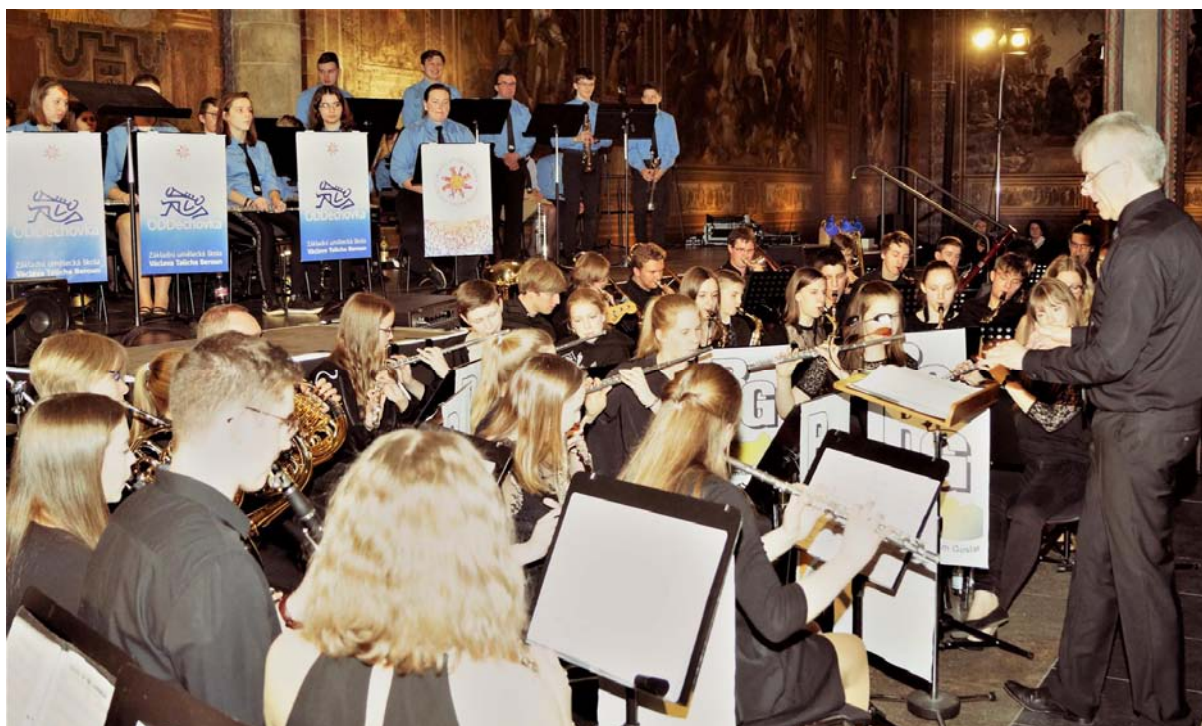
Foto: Společný koncert se Symphonisches Orchester Ratsgymnasium Goslar v Císařském paláci