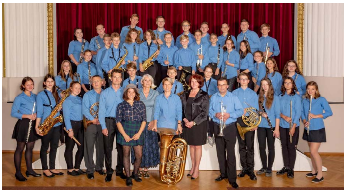
Foto: Dechový orchestr ODDechovka - foto pořízené na památku výměnného pobytu v partnerském městě pro vedení Ratsgymnasium Goslar.