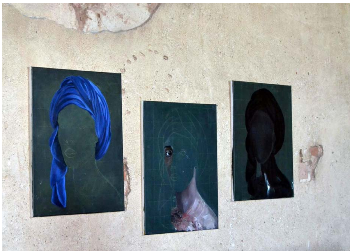
Foto: Výstava kursistů kresba-malba pro dospělé proběhla v prostorách hradu Točnick

Celkem se kurzů doplňkové činnosti účastnilo 121 účastníků. Doplňková činnost má pro školu i pozitivní ekonomický přínos. Budovy školy jsou využívány i v dopoledních a pozdních večerních hodinách.