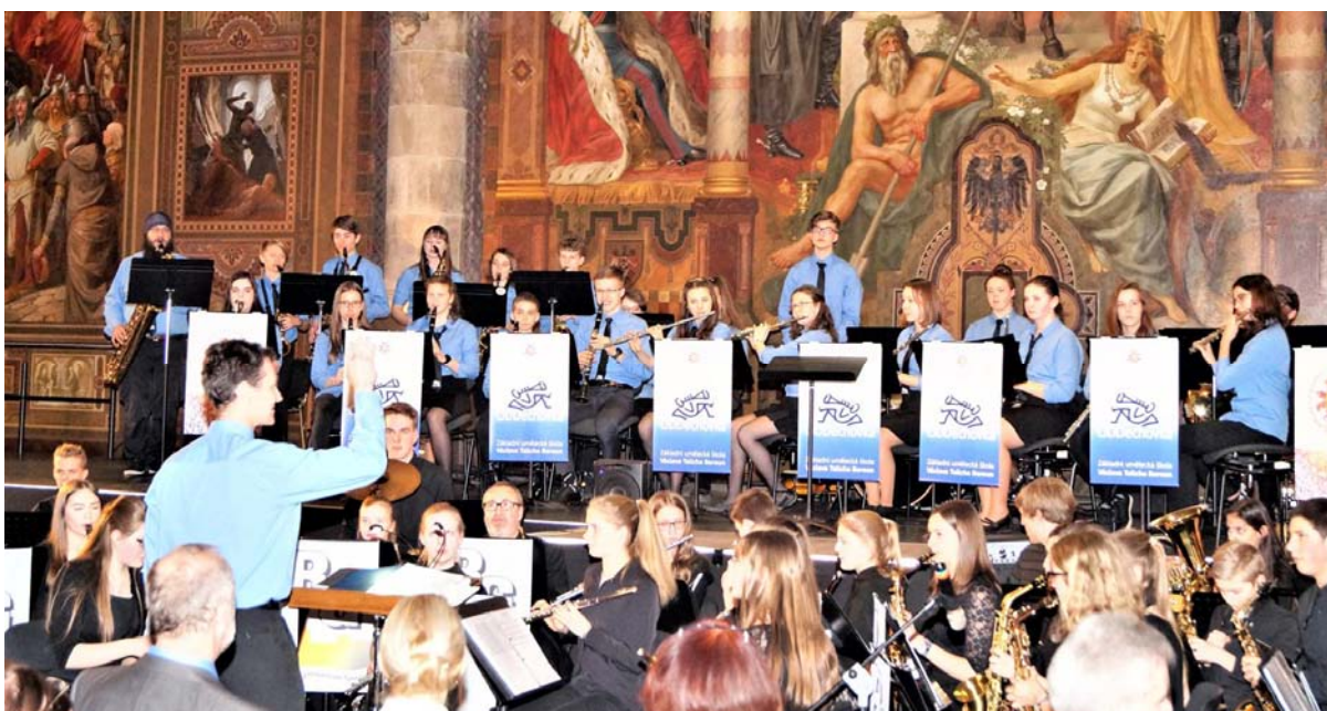
Foto: Společný koncert se Symphonisches Orchester Ratsgymnasium Goslar v Císařském paláci