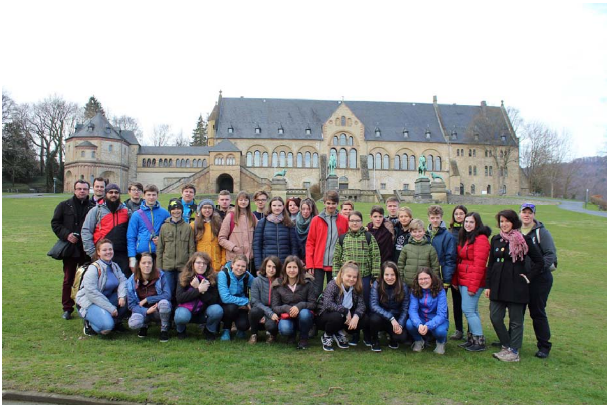
Foto: Dechový orchestr ODDechovka před Císařským palácem v partnerském městě Goslar